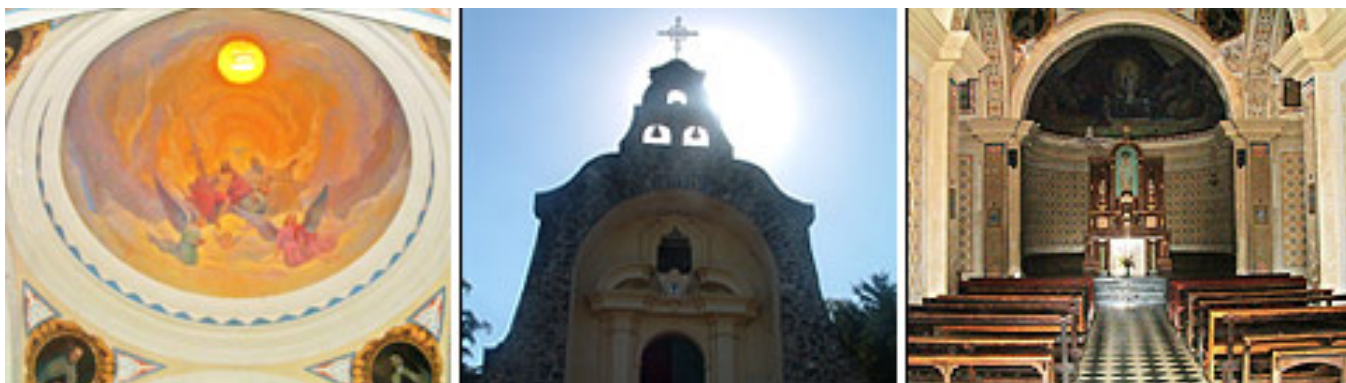
Solares y Nieto

De estilo barroco y colonial ostenta un interior en forma de cruz romana, cuyo extremo superior culmina en el Altar Mayor.